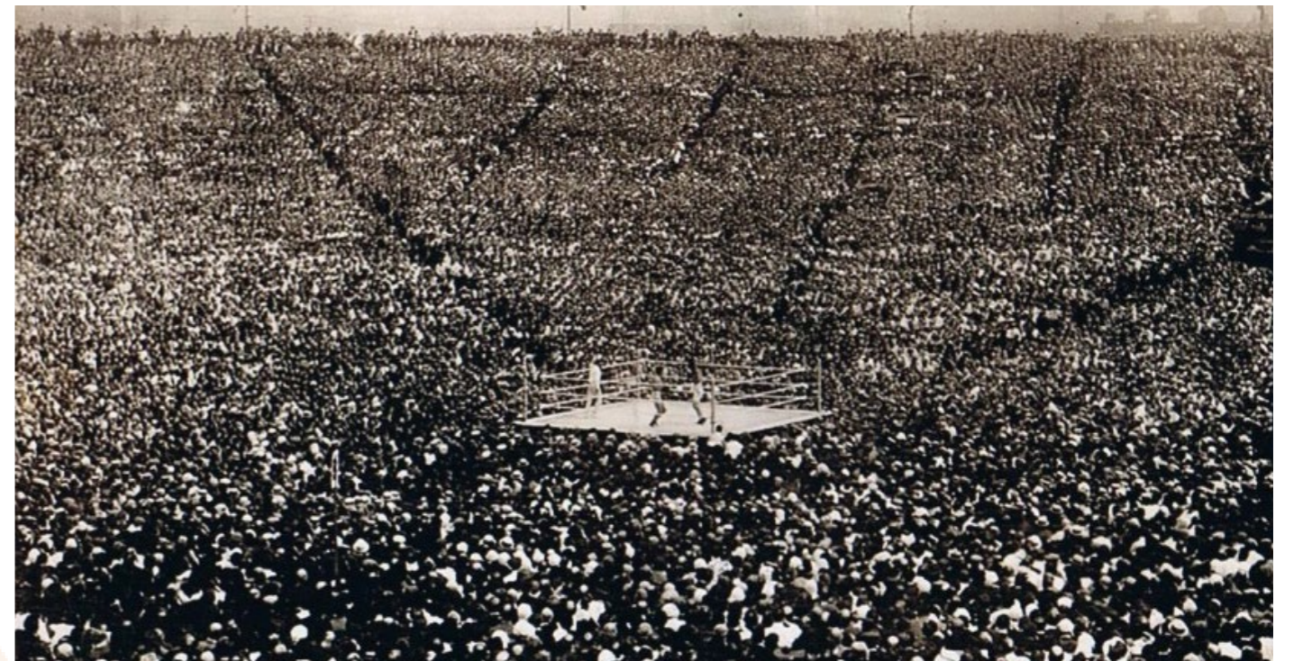
Tymczasowy obiekt sportowy dla ponad 90 tysięcy widzów zbudowany przez Texa Rickarda, walka Jacka Dempsey'a vs. Georges Carpentiere'a.

W momencie, gdy Tex Rickard obejmował prawa do organizacji imprez w Madison Square Garden, miejsce to nie przynosiło już oczekiwanych zysków finansowych. Ambitny promotor ocenił, że walka dwóch bokserów Amerykanina Jacka Dempsey'a i Francuza Georges Carpentiere'a jest niezwykłą okazją do zarobienia dużych pieniędzy. Nawet się